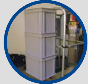
Ablagekorb für Beleuchtungslamellen