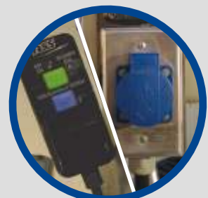
Steckdose mit FI