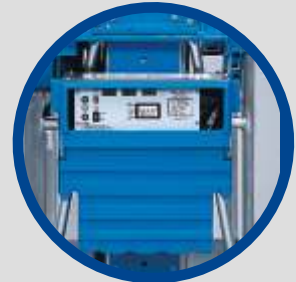
Batterieantrieb mit Ladegerät